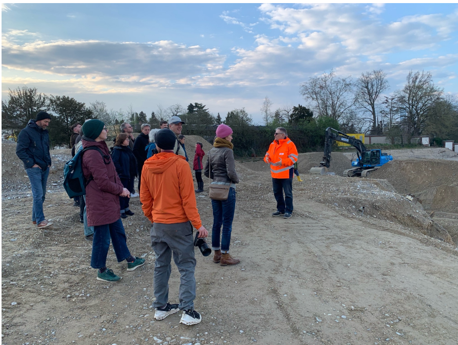
Begehung Areal Walkeweg, 22. März 2025, Foto: Gundeldigner Koordination

Beim Projekt Dreispitz Nord begleitet sie das Bauprojekt, informiert die Bevölkerung und setzt sich für gute Wohnqualität und ÖV-Anbindung ein.