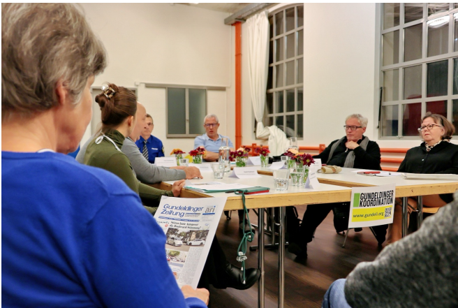
Verkehrssituation Tellplatz – wie weiter?, 04. November 25

will die GuKo im Jahr 2026 neue Akzente setzen, den Dialog im Quartier stärken und vorantreiben, vernetzend wirken und niederschwellige Formate schaffen.