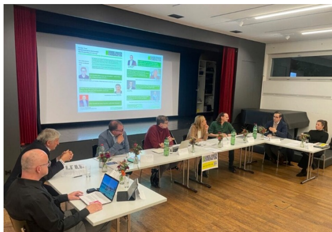
Parkplatzproblem im Gundeli: Quartierparking als Lösung?, 21. Oktober 25