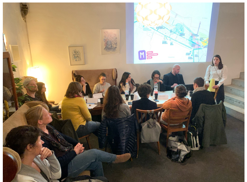
Öffentliche Nutzung von Schulhäusern im Gundeli – Chancen und Konflikte, 26. Februar 25