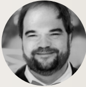
..... Tim Cuénod , Präsident (SP/ Sozialdemokratische Partei)