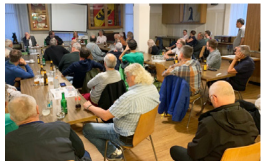
Bilder: Tim Cuénod, Nicolette Seiterle