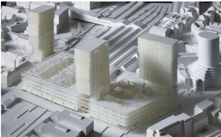
Modellansicht Ost

Die Post und die SBB lassen den sogenannten „Rostbalken“ – das Postreitergebäude am Bahnhof SBB – sanieren. Das Siegerprojekt ist vom Architekturbüro Bruther (Paris/Zürich). Ihre Projektstudie überzeugt mit einer optimalen Lösung, um das Gundeli und die Innenstadt mit einer Fussgänger:innen- und Veloüberquerung zu verbinden. Die Überquerungen sind voneinander getrennt, was den Verkehr entflechtet und Konflikte entschärft. Ein besonderes Augenmerk liegt ausserdem auf dem nachhaltigen Umgang mit den vorhandenen Strukturen. Es wird eine grosse Galerie geben und eines der drei geplanten Hochhäuser soll freigestellt werden, damit das Projekt in Etappen realisiert werden kann. Alle drei Hochhäuser haben eine maximale Höhe von 89 Metern. Es werden Büro- und Dienstleistungsflächen, öffentliche Nutzungen und Wohnungen – auch im preisgünstigen Segment – gebaut. Damit erfüllt das Projekt die politischen Forderungen im Bebauungsplan. Weitere Informationen unter www.nauentor.ch